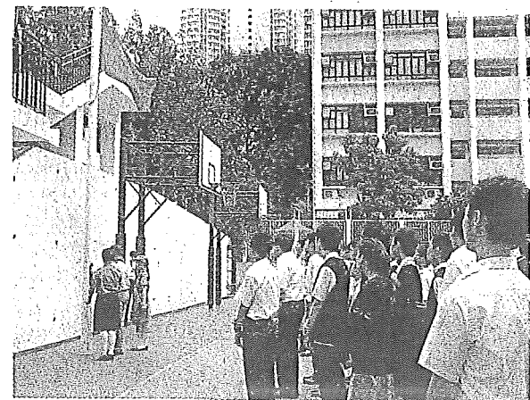
▲兩岸四地青少年聚集聖公會林護紀念中學，參加升旗禮