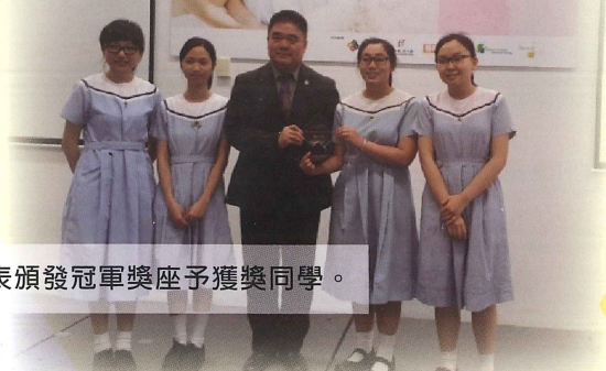
教育同代表頒發冠軍獎座予獲獎同學。