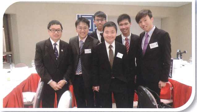
校長(左一)、領隊老師(左二)與「恒隆數學獎」得獎同學合照

校外比賽方面 五位2014年畢業生代表林護中學獲得「恒隆數學獎」優異獎。得獎學生、領隊老師及學校共獲得逾十萬元港幣的獎學金及發展基金，校長和領隊老師還獲邀出席得獎晚宴，實屬殊榮。繼2006年獲得金獎後，這是本校第三次在「恒隆數學獎」中獲獎。是次的得獎論文，是以數論方法，研究所有奇數被除數整除的快速驗算法。如果同學想知道怎樣快速驗算41479001能否被83(或任何其他奇數)整除，就要研讀學長的論文了。