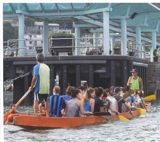
A group of CNETs perfecting the art of Dragon Boat Racing.