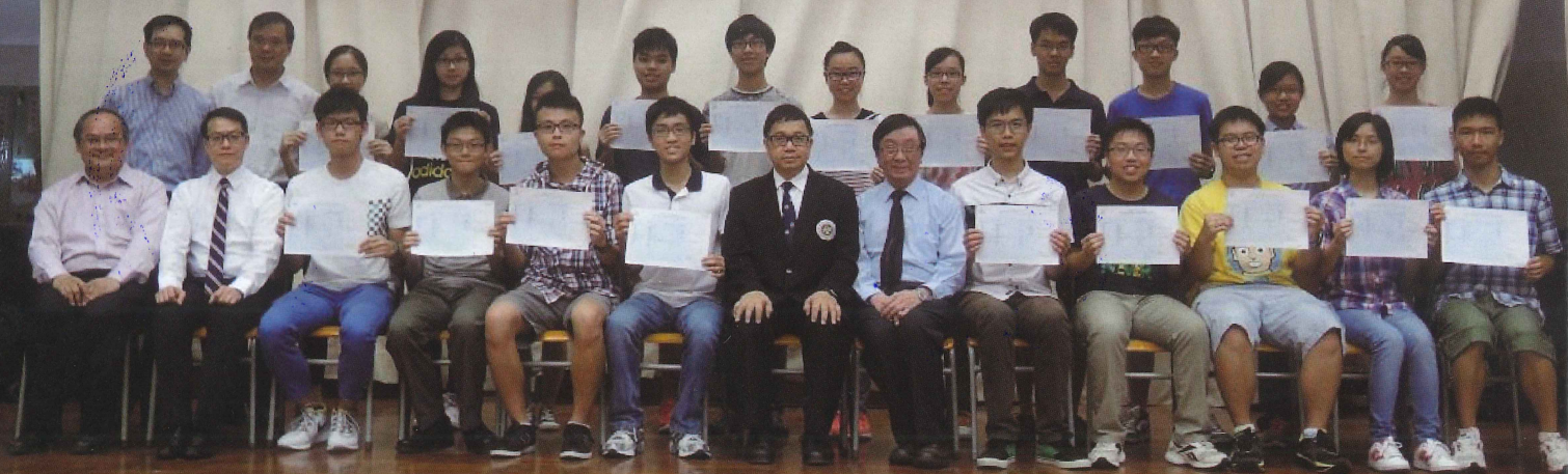
校長、老師和應屆文憑試成績優異同學合照