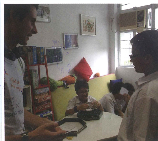
Here's myself going around and getting students to ask questions.