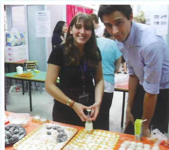
Me and a fellow CNET, attempting to make Mooncakes, in the lead up to the Mid-Autumn Festival

As I mentioned, I'm a Chatteris Native English Tutor (CNET). Chatteris is a non-profit charitable organisation that aims to help improve Hong Kong students English language skills by placing them with a native English speaker (such as myself). The benefit of being a CNET is that you can teach in a classroom, while also being heavily involved in activities outside the classroom and around the school. This makes interacting with students much easier as they can see me as a friend rather than a teacher that sets their exams.