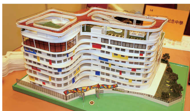
歷時約 9 個月進行資料搜集、問卷調查、設計及製作的作品

我們的參賽方案以「無限」為創作意念，建議學校原址重建成多功能的環保建築。比賽歷時 8 個多月，我們需提交建造校園的計劃書，並製作模型及投影片向評審介紹。賽會亦安排一位來自建造業界的專業導師，在我們構思過程中，提供關於建造及環保設施的意見。