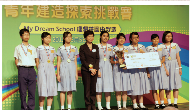
由發展局局長林鄭月娥女士頒發獎項給得獎同學

我們的參賽方案以「無限」為創作意念，建議學校原址重建成多功能的環保建築。比賽歷時 8 個多月，我們需提交建造校園的計劃書，並製作模型及投影片向評審介紹。賽會亦安排一位來自建造業界的專業導師，在我們構思過程中，提供關於建造及環保設施的意見。