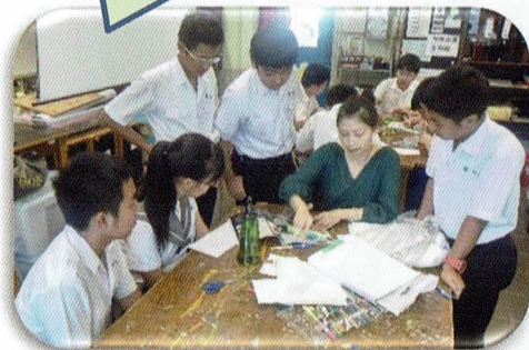
授業体験(美術)をしました!